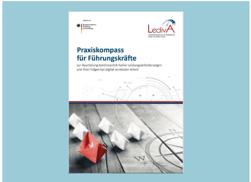
PDF-Download des LedivA Praxiskompasses

Damit Kundenbetriebe überhaupt Maßnahmen zur Arbeitsentlastung treffen können, müssen sie wissen, welche Belastungen es im Arbeitsalltag für die Beschäftigten gibt. Der Praxiskompass beschreibt folgende Belastungen: