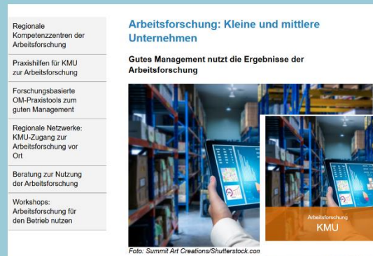
Plattform Management – Arbeit - Forschung