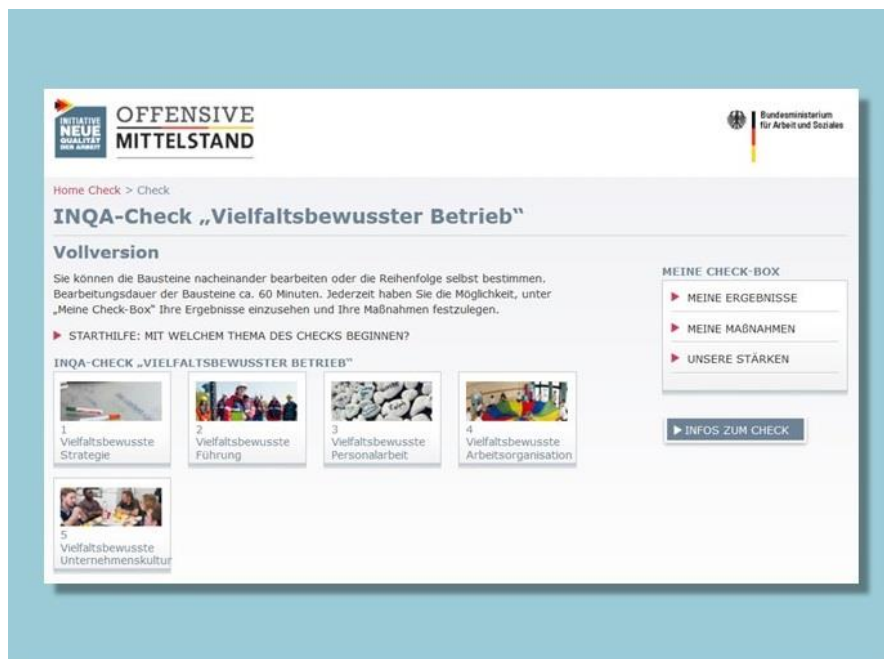
Online-Tool des INQA-Checks „Vielfaltsbewusster Betrieb“ (OM-Praxis A-2.2) © Offensive Mittelstand/Stiftung „Mittelstand – Gesellschaft – Verantwortung“

oder nutzen, wobei online zusätzliche Filtermöglichkeiten bestehen.