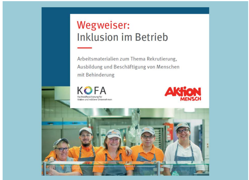
PDF-Download KOFA-Wegweiser: Inklusion im Betrieb

Steckbriefe zu unterschiedlichen Behinderungsformen dienen der