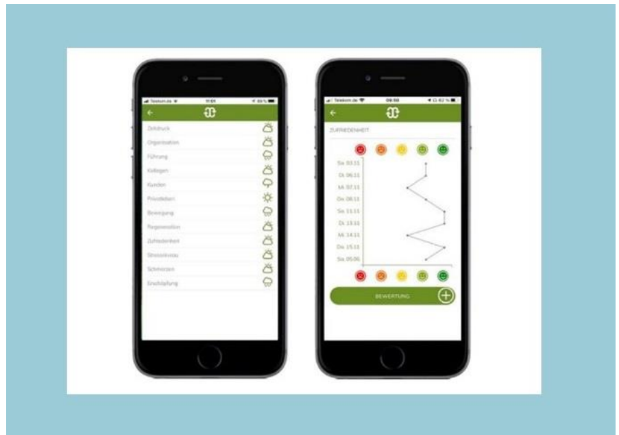
Bewertungsseite der DOSIMIRROR-APP

Führungskräfte können die APP aber auch ihren Beschäftigten empfehlen und ihnen anbieten, die Ergebnisse