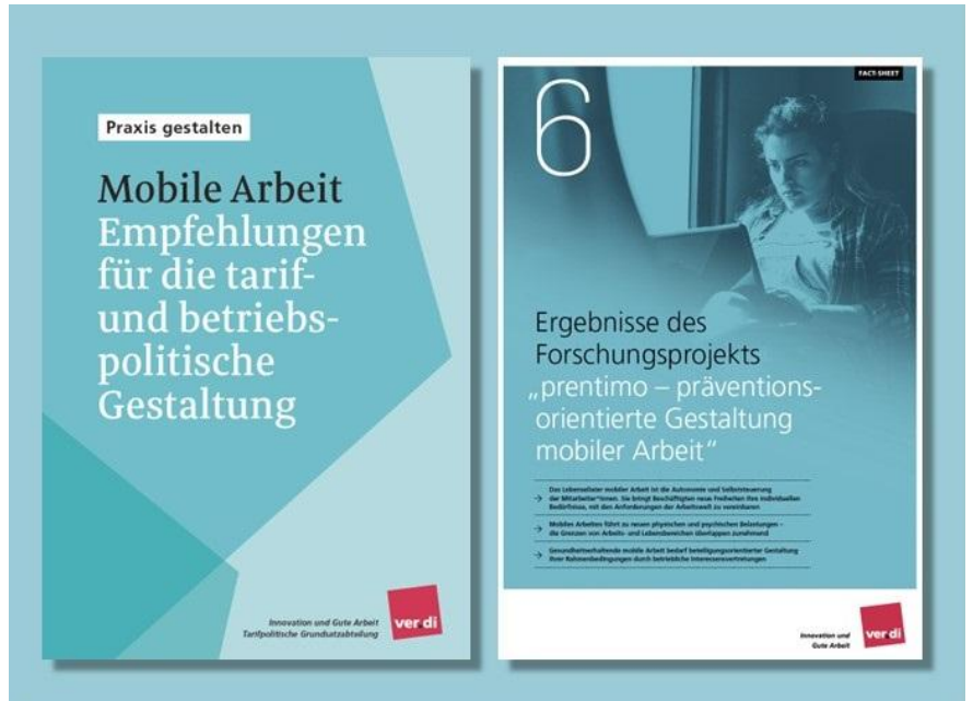
Titel der prentimo-Empfehlung für Betriebsvereinbarungen zur mobilen Arbeit (links) und dem Factsheet zur Mobilen Arbeit für Interessenvertretungen (rechts)

Die Empfehlungen für die tarif- und betriebspolitische Gestaltung enthalten Vorschläge und Anregungen, wie die Gestaltung der mobilen Arbeitswelt, mittels Tarifverträge und Betriebsvereinbarungen, im Sinne der Beschäftigten umgesetzt werden kann.