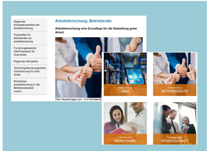
Plattform Management – Arbeit - Forschung © Offensive Mittelstand