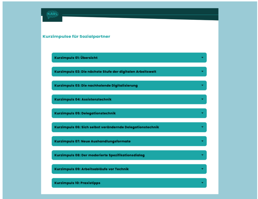
Überblick über die Kurzimpulse für Sozialpartner des Kompetenzzentrums KARL

Die Kurzimpulse wurden explizit für Sozialpartner entwickelt und haben sich das Ziel gesetzt, u. a. Betriebsräten kompaktes KI-Wissen in Alltagssprache zu vermitteln. Sie liefern Empfehlungen und Informationen für die Wahrnehmung des Mitwirkungs- und Mitbestimmungsrechts der Betriebsräte bei Auswahl, Gestaltung, Einsatz und Nutzung von KI im Betrieb.