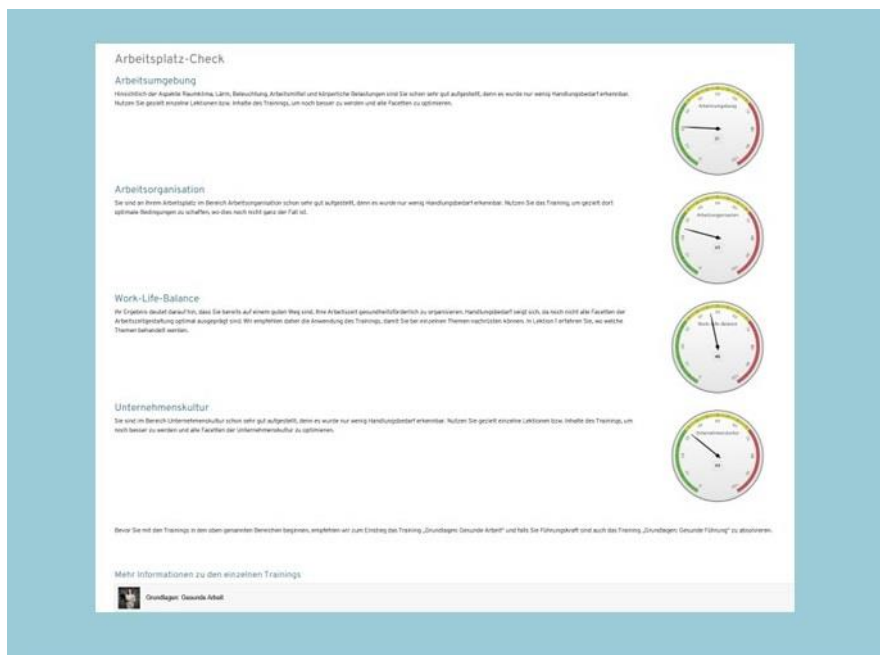
Ergebnisanzeige des Implement-Arbeitsplatz-Checks

Mit den Implement-Online-Trainings können Beratende gemeinsam mit den Kunden deren Bedarf und Interesse entsprechend herausarbeiten und ermitteln welche Maßnahmen zur Verbesserung der Situation möglich und sinnvoll sind. Die Beratenden finden so einen Leitfaden im Beratungsprozess, wie die Arbeit beim Kunden gestalten werden kann, so dass die Beschäftigten gesundheitsgerecht, zufrieden und produktiv arbeiten können und wie dort jeder – auch die Führungskräfte selbst – Stress bewältigen können.